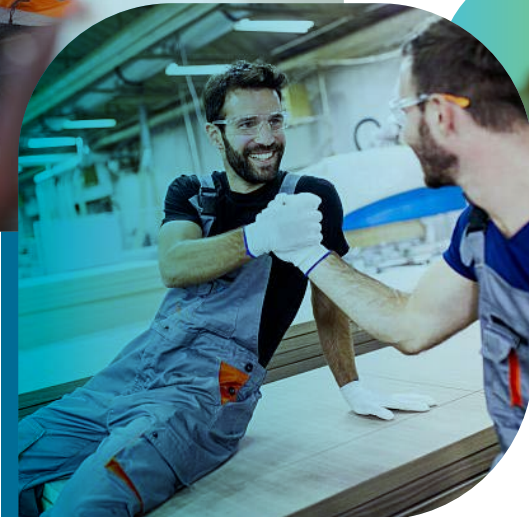
CALL- UND SERVICE-CENTER